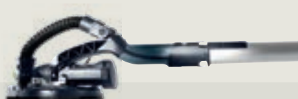
PLANEX LHS 225 hosszúszárú falcsiszoló