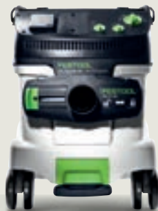
CLEANTEX CTM/CTL 36 E AC HD elszívómobil