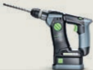
BHC 18 akkus fúrókalapács