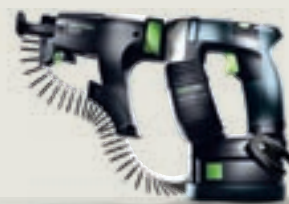
DURADRIVE DWC 18-4500 csavarbehajtók szárazépítési munkákhoz