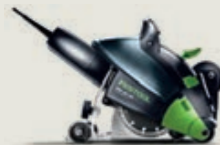
DSC-AG 125 gyémántvágó