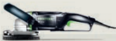
RENOFIX RG 130 gyémántcsiszoló