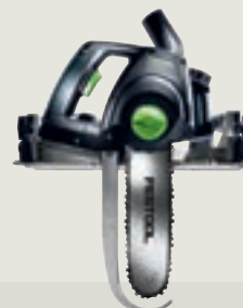
UNIVERS SSU 200 láncfűrész