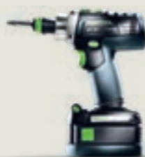
QUADRIVE PDC 18/4 akkus ütvefúró-csavarbehajtó