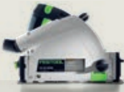
TS 55 R merülőfűrész

További termékváltozatokat a www.festool.hu oldalon talál