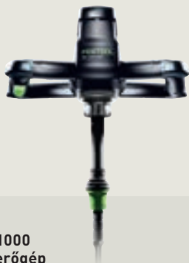
MX 1000 keverőgép