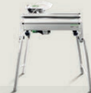
PRECISIO CS 50 asztali vonó-leszabó fűrész